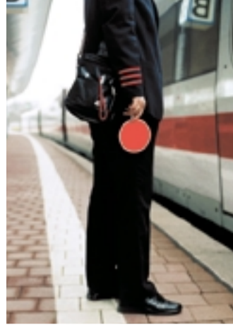
Risiko Eisenbahn: Schaffner sind nach Gleisbauern die gefährdetste Gruppe