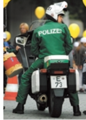
Sichere Polizisten: Nur jeder Zehnte wird vor dem Rentenalter berufsunfähig