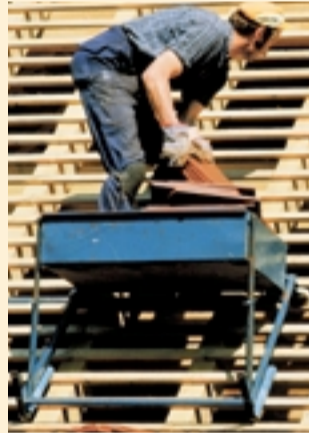
Risiko hoch: Nur 36 von 100 Dachdeckern schaffen es heil bis zur Rente

platzes erlaubt Selbstständigen oft, ihren Job weiterzuführen. Bei Angestellten verlangt das nur noch jeder vierte Anbieter. Auch Standard: Leistungsbeginn im Monat, der auf den Eintritt der BU folgt. Und großzügiger Umgang mit Meldefristen. Die meisten Policen haben weltweite Geltung. Generelle Leistungsausschlüsse wie Flugsport, Terror oder Strahlung sind selten geworden.