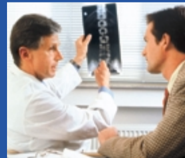
Rückenleiden und psychische Erkrankungen sind die häufigsten BU-Ursachen

Ohne private Invaliditäts-Vorsorge ist man also schnell arm. Denn verglichen mit dem finanziellen Verlust durch Berufsunfähigkeit, ist ein neues Auto nur einen Klacks wert. Trotzdem werden BMW, Merce-