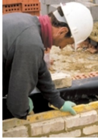
Risiko Baustelle: 59 Prozent der Maurer legen die Kelle vorzeitig aus der Hand